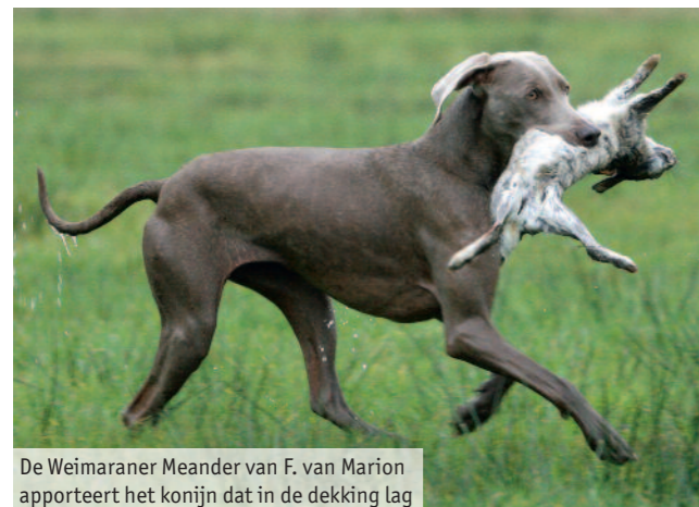
De Weimaraner Meander van F. van Marion apporteert het konijn dat in de dekking lag

De voorjager moet nazoek doen op twee konijnen, een fazant en een haas. Eén van de konijnen is inmiddels geraapt. Het andere konijn ligt links van de voorjager in een bosje. De fazant is echter een loper en dient als eerste geapporteerd te worden. Als de hond met de loper terugkomt, schiet een jager in een hutje een eend die hij zelf raapt. Daarna mag de hond ingezet worden op het konijn, links in het bosje, of op het haas dat achter de voorjager in een jonge aanplant op ongeveer 150 meter ligt. Uiteraard dienen ook deze stukken binnen te komen binnen de gestelde tijd.