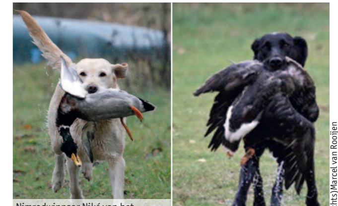
Nimrodwinnaar Niké van het Muntenbos brengt tijdens proef B de eend binnen

Dit was een pittige proef. Veel voorjagers hadden moeite hun honden naar de gans te dirigeren. Naast de verleiding van de geschoten en geraapte duif, bleek ook de gedraaide wind de honden parten te spelen. Hierdoor kwam diverse keren de eend