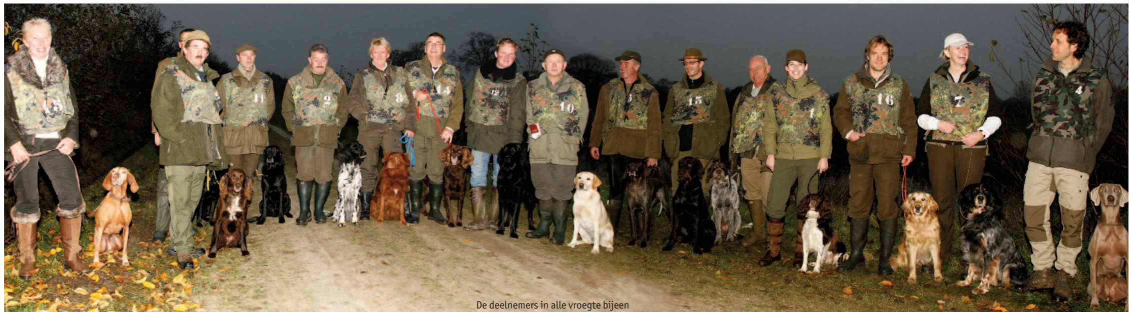
De deelnemers in alle vroegte bijeen

Er waren maar enkele honden die de duidelijk opgeworpen duif en kraai ook daadwerkelijk markeerden. Een van de oorzaken lag in het feit dat de honden achter de weglappende drijvers en het geweer aanliepen en daardoor de valplaatsen vergaten. Er kwam dan ook veel dirigerwerk aan te pas. Hoewel op de markeerproef van de KNJV-proef de werper en het geweer niet van hun plaats komen, is het misschien wel verstandig dit in de training op te nemen.