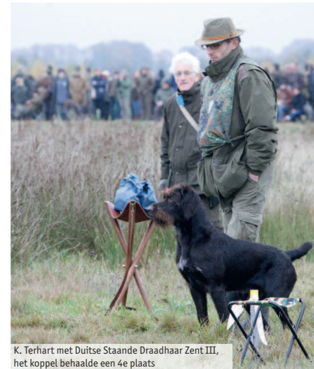
K. Terhart met Duitse Staande Draadhaar Zent III, het koppel behaalde een 4e plaats

Tekst: Marcel van Rooijen