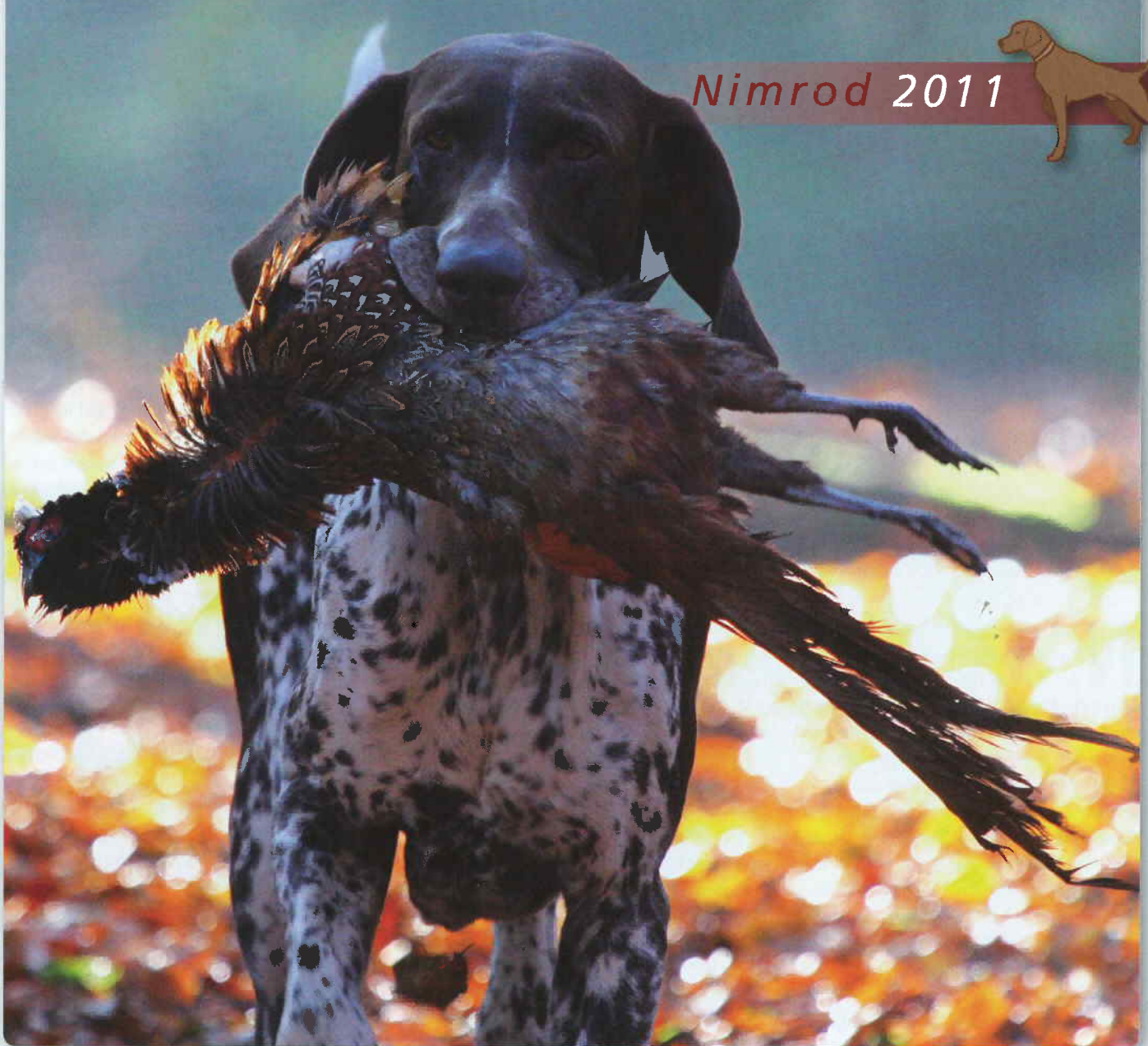
Gabber v/d Slotbosse-Heide (Ad van Dongen).