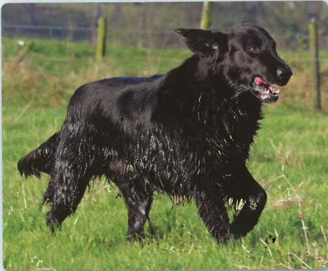
Moest helaas afhaken vanwege blessure : Flatcoat Roghcovers Billy Bluebill (Egbert Bal)